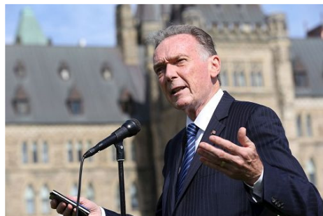
▲国会议员 Peter Kent 于九月二十二日现场支持法轮功，并在发言中敦促中国领导人法办江泽民。

和向中国民众讲法轮功被中共迫害的真相，都遭受过肉体和精神折磨。他们二零零四年就在加拿大以反人类罪控告了江泽民。