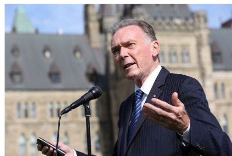
▲国会议员 Peter Kent 于九月二十二日现场支持法轮功，并在发言中敦促中国领导人法办江泽民。

和向中国民众讲法轮功被中共迫害的真相，都遭受过肉体和精神折磨。他们二零零四年就在加拿大以反人类罪控告了江泽民。