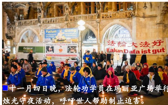
■十一月四日晚，法轮功学员在玛丽亚广场举行烛光守夜活动，呼吁世人帮助制止迫害。

【明慧网】（明慧记者兰玲、李欣慈德国慕尼黑报道）二零一六年十一月四日、五日晚，来自欧洲不同国家的部份法轮功学员分别在玛丽亚广场和 Max-Joseph 广场以烛光守夜的方式，揭露中共酷刑迫害法轮功学员，甚至活摘法轮功学员器官牟利，同时呼吁世人支持正义，帮助制止中共对法轮功学员的迫害。