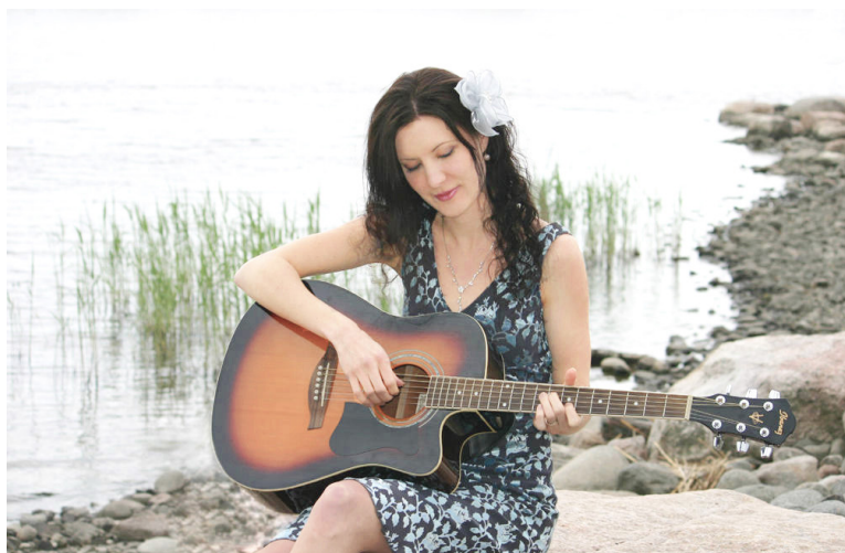
▲ 淡泊、从容的芬兰民谣新星安娜·科克宁