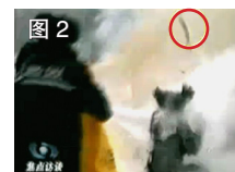
图 2 一条状物弹起