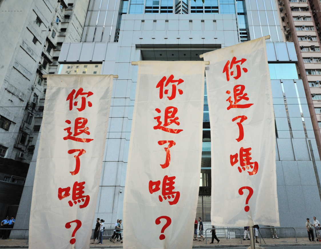
▲ 2011年8月21日，香港民众庆祝退党大游行，标语横幅“你退了吗？”

《九评共产党》简称《九评》是《大纪元时报》于2004年11月发表的系列评论性文章，自发表以来引发退出共产党相关组织的三退运动。外媒指出，《九评》是对中共的历史、意识形态、做法，以及诸此对中国文化、价值观及中国人产生的影响，所做的系列回顾和剖析。用翻墙软件登录 tuidang.epochtimes.com ，一睹为快！