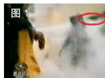
图 1 凶手猛击刘的头部