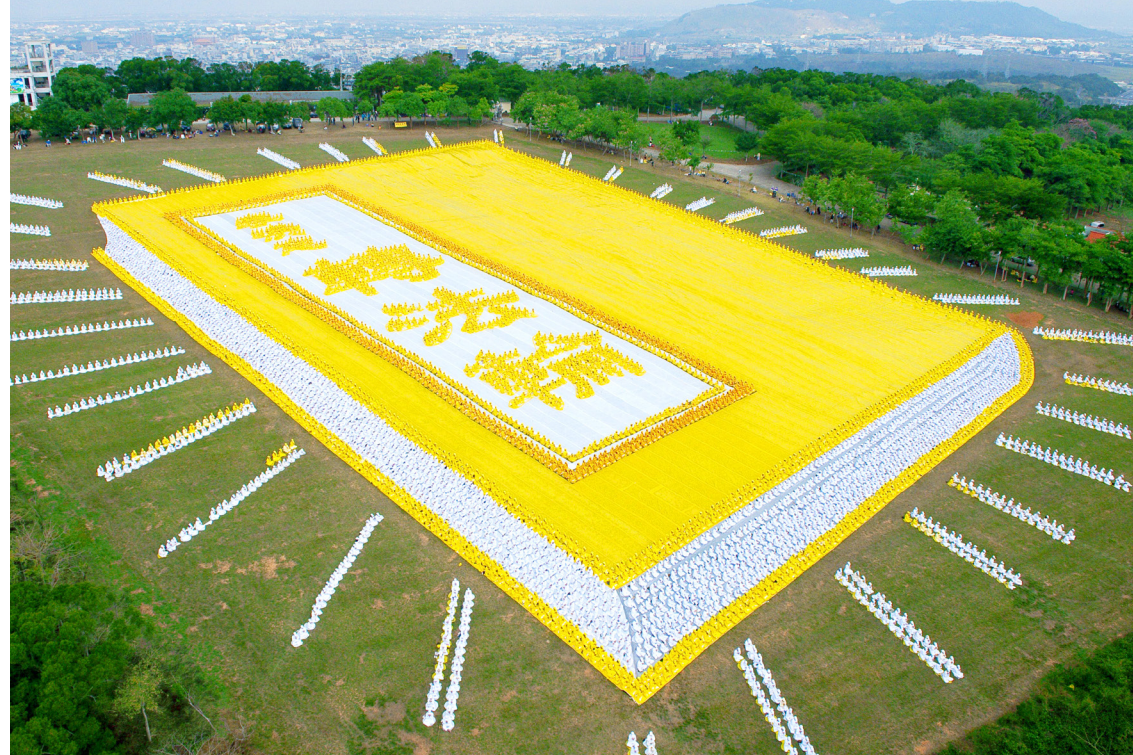
▲ 6000 多位法轮功学员在台湾排出《转法轮》一书的模型

在塞佩莱和同事进行的多项研究中，有一项是审视医疗行业中的慈悲同情。研究发现，当从业者压力太大时，会很难感到并表达出对他人的关爱同情。“在医学院受训期间，近半医学学生都体验到压力带来的职业倦怠，11% 因过劳、生活质量下降和抑郁症状而有过自杀念头。在住院医师中，有近 20% 人的心理健