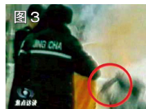
图 3 用手摸头，突然倒地