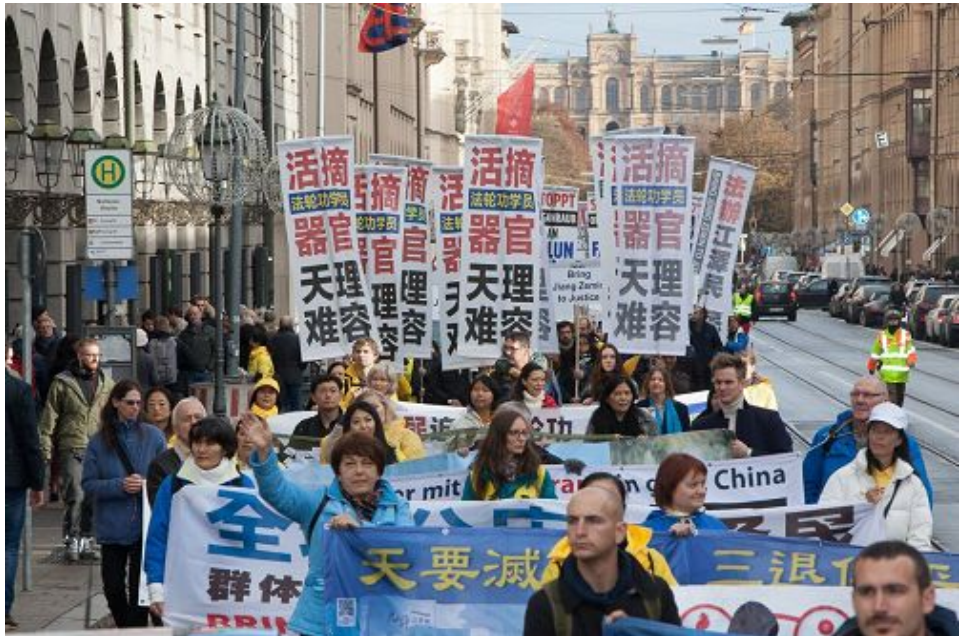
图：十一月五日，欧洲法轮功学员在德国慕尼黑大游行。

中共活体摘取法轮功学员器官的活动也是非常重要的，在公开场合中能够让更多的人了解，并能让媒体来报道。所以我来到这里声援这项活动，也带来我的研究结果，希望这件事情能在德国广为人知。”他还表示自己认识很多法轮功学员，“我很惊讶于法轮功的效果，他们给我留下很深的印象，我讶异于法轮功学员在中国极艰苦的条件下，还能将道德水准真、善、忍付诸于行动。”