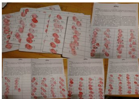
图：湖北咸宁部分百姓签名。

自二零一五年五月以来，湖北省咸宁市法轮功学员纷纷用实名向最高法院、最高检察院控告迫害法轮功的元凶江泽民，要求将江泽民逮捕法办，很多控告状都被两高院签收。