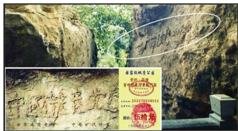
图为巨石“藏字石”的断裂面和风景区的门票。

■2002年6月,贵州省平塘县掌布乡发现一方巨石,断面惊现六个大字:中国共产党亡(见下图平塘县风景区门票)。经地质专家组考察证实:巨石有2.7亿岁,崩裂于500年前,断面的字是天然的化石纹理,文字图案上还有2亿年前的古生物化石碎屑,人工无法伪造。新华网、中央电视台、人民日报等一百多家大陆媒体都曾对此做过专题报导,但都隐去了最后一个“亡”字。“藏字石”向人们昭示着“天灭中共”的天机。天灭中共在即,这必将祸及仍然追随中共的人,愿您顺应天意,快快“三退”(退党、团、队)保平安!◇