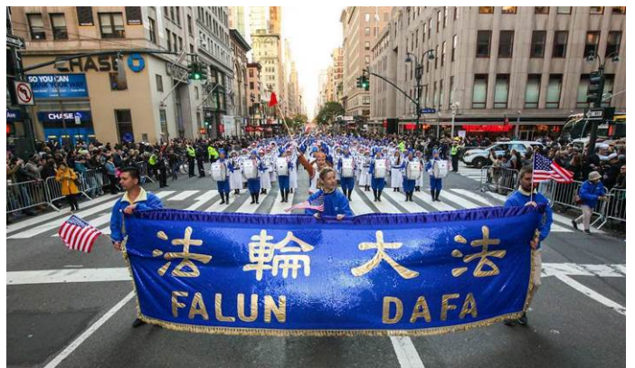
▲ 法轮功学员参加纽约市第九十七届老兵节游行

她说,美国老兵服务局每年都邀请法轮功学员参加游行,“一方面因为我们的队伍漂亮、壮观,带给人们正的能量;另一方面也说明主办方很认同我们真、善、忍的价值,支持我们对信仰的追求。”◇