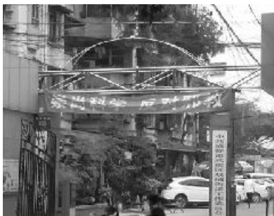
双楠办事处挂污蔑大法的标语

一九九九年七月开始，双楠办事处和派出所积极配合打压政策，对凡是挂了名的大法学员都上门，抓人、送劳教、送洗脑班，过后有的转化放弃了修炼，有的