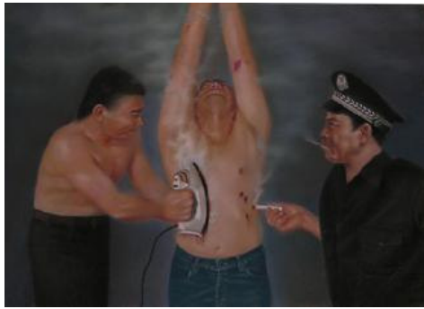
酷刑演示：火烫（绘画）

上的一百二十五元现金。他们先用电棍打我，然后用手铐铐住我的双手，将绳子拴在手铐上，把我吊在房梁上，只让我的两脚尖接触地面，两个小时往地下放一次，等十几分钟又吊上去。如此折磨我三天三夜，又送我到派出所继续迫害。