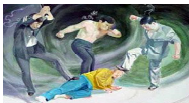
中共酷刑示意图：殴打

拳打脚踢、电棍电击、木棍暴击、哑铃击打、铁链锁甩击、大铁扳手捶击、电线鞭抽打等各种各样的恶毒殴打是豫章监狱摧残法轮功学员最常见、最残暴的迫害手段。