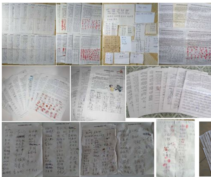
■ 廊坊民众签名举报或支持控告江泽民签名按手印的部份图片

一个老农民说: 江泽民当官以来没干什么好事, 早就应该逮捕它。一个卖佐料的男子说: 江泽民什么能耐也没有, 就知道贪污。一个退休老干部说: “江泽民贪腐治国, 造成全国