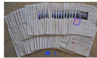
■ 张家口市周边县民众联名举报江泽民