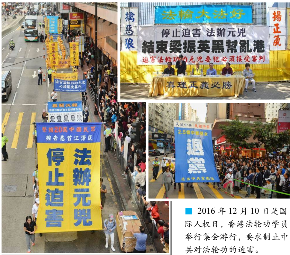
■ 2016 年 12 月 10 日是国际人权日，香港法轮功学员举行集会游行，要求制止中共对法轮功的迫害。

黄金秋说：“除了中国大陆之外，法轮功学员在国外都是合法的存在，没有任何的国家或社会因为法轮功而受到颠覆或者有什么危害性，反而见识到法轮功的真、善、忍给社会