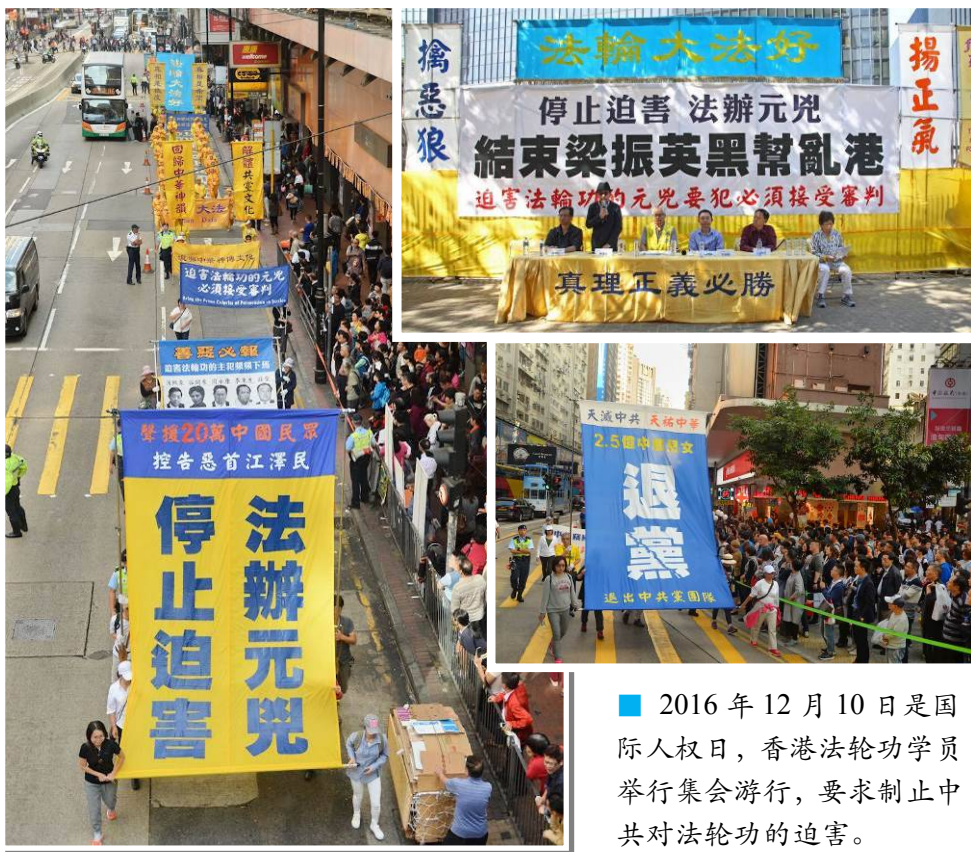
■ 2016 年 12 月 10 日是国际人权日，香港法轮功学员举行集会游行，要求制止中共对法轮功的迫害。