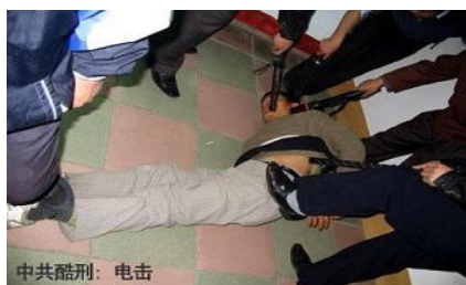
酷刑演示：电棍电击

恶警不让他上厕所，不让吃饱，在他的饭、菜、馒头上吐唾沫。犯用棉袄把他的头蒙上，四、五个人打他的头，最后造成脑膜炎积水，发高烧，三、四个月的时间，脸色煞白，不能走路，被送进医院。监狱为了推卸责任，让他保外就医。◇