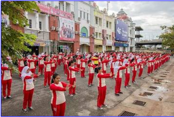
Tiara Bangsa 高职学生正在学法轮功动作