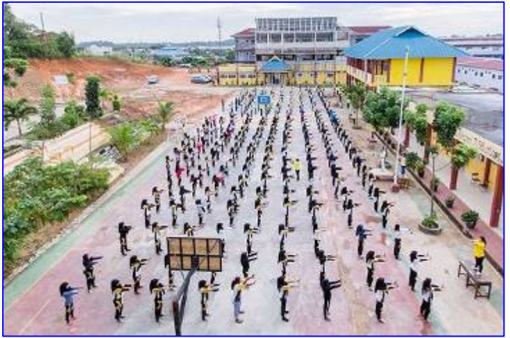
国立七巴淡高中的学生与老师们一起学炼法轮功