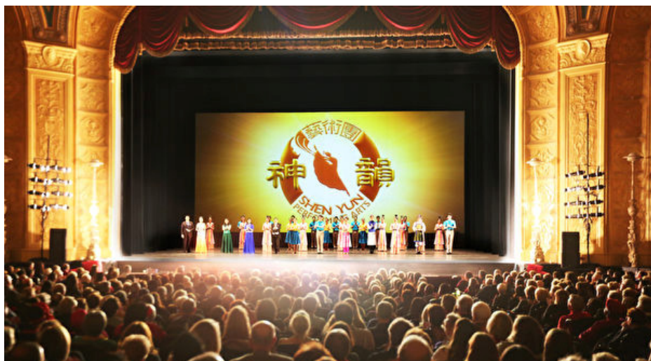
■ 2016年12月26日下午，底特律歌剧院内全场爆满的观众如潮的掌 声一次次响起，感谢神韵艺术团为他们带来的新年大礼。

如果有机会你能出国观看神韵 演出，也许你会发出由衷的感慨： 中国有希望了，历史上万国来朝的 荣景将重回神州大地。来生我愿再 做中国人。◇ 注：请访问神韵官方 网站 (www.shenyun.com) 查询最新 的演出日程和演出详情。