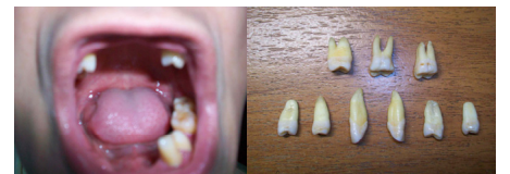
图：口腔里大部份牙脱落，保留下来的牙不全了，还有一些在狱中被警察搜号时给搜走了。

“这要是把你媳妇弄来，扒光了衣服同样的给她一穿，我也脱了往她腿上一坐……”——这就是中共邪党的邪恶与下流。