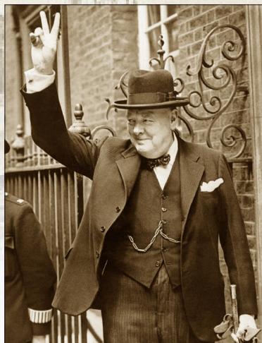
1940年5月20日，丘吉尔任英国首相十天后，德国军队到达英吉利海峡。面对严峻形势，丘吉尔以V字形手势，向民众传达正义必胜的信心。

回顾二战的历史，其中有几件相似的事情：战争爆发之前，英法两国对纳粹采取绥靖政策，苏联共产党政权与纳粹沆瀣一气。这无疑成了希特勒发动二战的必要条件。而这些国家直到大祸临头才清醒，但为时已晚，他们曾经占有的巨大军事优势在姑息、妥协和同流合污中迅速瓦解，他们面对的是强大的敌人和前所未有的困境。这些国家在纵容邪恶时所获得的利益，也在战争一开始就付诸东流。