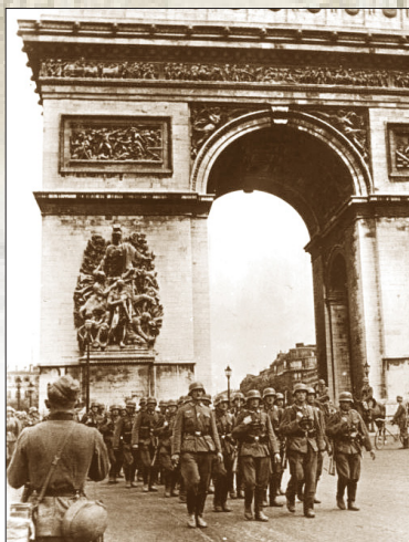
德军占领法国巴黎后进入凯旋门

2006年，在唐山大地震30周年之际，揭露唐山地震真相的长篇调查报告《唐山警世录》在1月甫出不久即被中共宣传