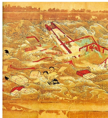
右图：《东征传》绘卷局部，鉴真东渡途中在狼沟浦遇险。