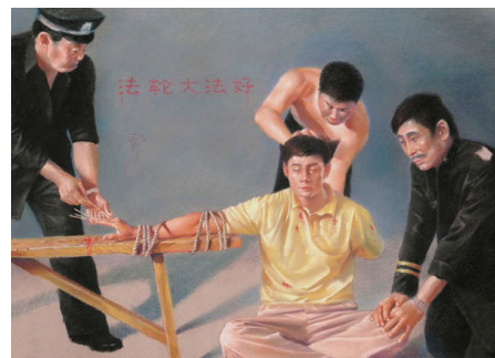
中共酷刑图示：用竹签扎手指