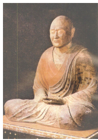
日本奈良唐招提寺的鉴真和尚像

饿死在茫茫大海的危险，还有来自唐朝政府的重重阻拦和拘禁等威胁。在他的大弟子祥彦和日本僧人荣睿因病去世、他自己也身毒入眼、双目失明、并且五次东渡失败之后，他还是坚定地扬帆