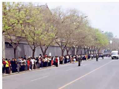
▲ 上访现场，秩序井然。

“四二五”和平上访，起因是中共江泽民集团不断制造事端，蓄意迫害法轮功：从1996年非法禁止出版法轮功书籍，到江泽民、罗干一伙扣押国务院总理对法轮功的正面批示；从1998年公安部四处派特务收集法轮功的“罪证”未果，再到动用公安强行驱散炼功群众，非法抄家……三年中，打压不断升级。最后终于由警察殴打及非法抓捕四十多名法轮功学员的天津事件，引发了1999年4月25日万人和平上访。法轮功学员上访，维护的是按“真善忍”做好人的权利，无关政治。◇