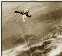
德军 Ju 87B “斯图卡俯冲轰炸机”轰炸色当周围的法军阵地

德军的飞机坦克证明了比利时这种想法的幼稚。1940 年 5 月 9 日至 10 日夜间，德军以大规模空袭比利时的飞机场、交通线、指挥中心和军火库为前奏，又在没有丝毫借口的情况下，向荷兰和比利时发动了闪电战。5 月 28 日，比利时向德国投降。德军很快在比利时与法国交界的色当撕开了法军的防御线，迅速南下，绕到马其诺防线的背后。6 月 14 日，德军占领法国巴黎。