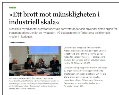
▲ 瑞典《医生报》专题报导“工业化大规模反人类罪”的网页截图