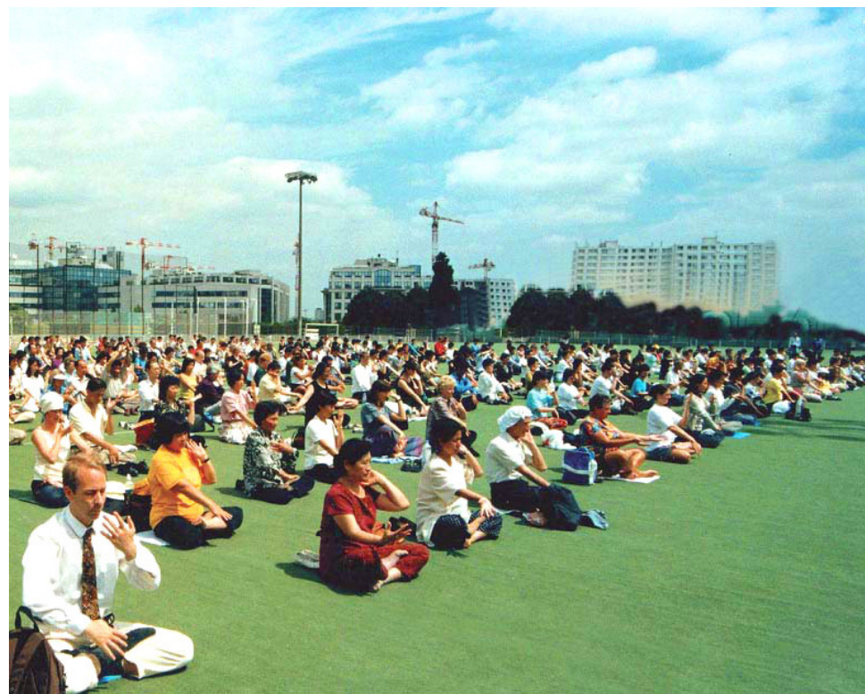
▲ 欧洲法轮功学员集体炼功

他到达天安门广场不久，广场开始清场，他又出示了特别证件才让他留下。当时广场上留下的人很少，这时他看到广场上已架好了摄像机，他以为有什么重要政治活动或拍什么片子。