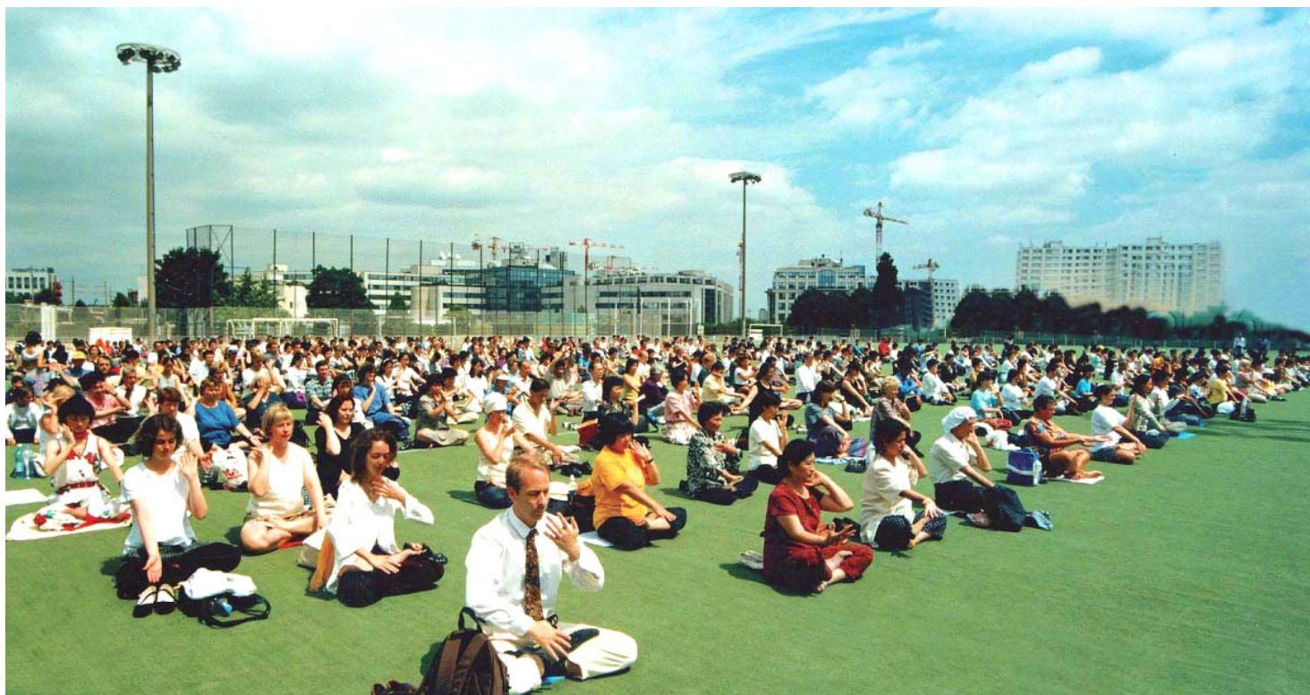
▲ 欧洲法轮功学员集体炼功