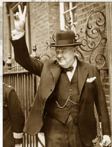
1940 年 5 月 20 日，丘吉尔任英国首相十天后，德国军队到达英吉利海峡。面对严峻形势，丘吉尔以 V 字形手势，向民众传达正义必胜的信心。

回顾二战的历史，其中有几件相似的事情：战争爆发之前，英法两国对纳粹采取绥靖政策，苏联共产党政权与纳粹沆瀣一气。这无疑成了希特勒发动二战的必要条件。而这些国家直到大祸临头才清醒，但为时已晚，他们曾经占有的巨大军事优势在姑息、妥协和同流合污中迅速瓦解，他们面对的是强大的敌人和前所未有的困境。这些国家在纵容邪恶时所获得的利益，也在战争一开始就付诸东流。