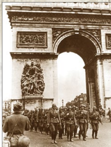
德军占领法国巴黎后进入凯旋门