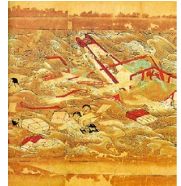
右图：《东征传》绘卷局部，鉴真东渡途中在狼沟浦遇险。