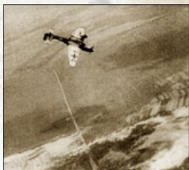
德军 Ju 87B “斯图卡俯冲轰炸机”轰炸色当周围的法军阵地

德军的飞机坦克证明了比利时这种想法的幼稚。1940 年 5 月 9 日至 10 日夜間，德军以大规模空袭比利时的飞机场、交通线、指挥中心和军火库为前奏，又在没有丝毫借口的情况下，向荷兰和比利时发动了闪电战。5 月 28 日，比利时向德国投降。德军很快在比利时与法国交界的色当撕开了法军的防御线，迅速南下，绕到马其诺防线的背后。6 月 14 日，德军占领法国巴黎。