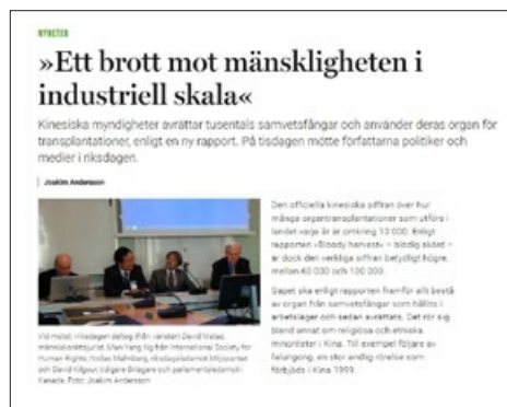
▲ 瑞典《医生报》专题报导“工业化大规模反人类罪”的网页截图

查看中国各地医院的（器官移植）统计数字，并把这些数字加起来，乔高和他的同事们得到了“每年在六万到十万例之间”这个数字。