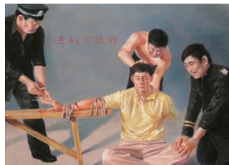
中共酷刑图示：用竹签扎手指