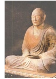
日本奈良唐招提寺的鉴真和尚像

饿死在茫茫大海的危险，还有来自唐朝政府的重重阻拦和拘禁等威胁。在他的大弟子祥彦和日本僧人荣睿因病去世、他自己也身毒入眼、双目失明、并且五次东渡失败之后，他还是坚定地扬帆