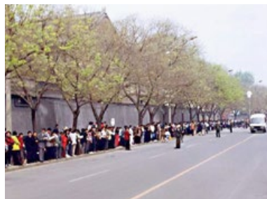
▲上访现场，秩序井然。

“四二五”和平上访，起因是中共江泽民集团不断制造事端，蓄意迫害法轮功：从1996年非法禁止出版法轮功书籍，到江泽民、罗干一伙扣押国务院总理对法轮功的正面批示；从1998年公安部四处派特务收集法轮功的“罪证”未果，再到动用公安强行驱散炼功群众，非法抄家……三年中，打压不断升级。最后终于由警察殴打及非法抓捕四十多名法轮功学员的天津事件，引发了1999年4月25日万人和平上访。法轮功学员上访，维护的是按“真善忍”做好人的权利，无关政治。◇