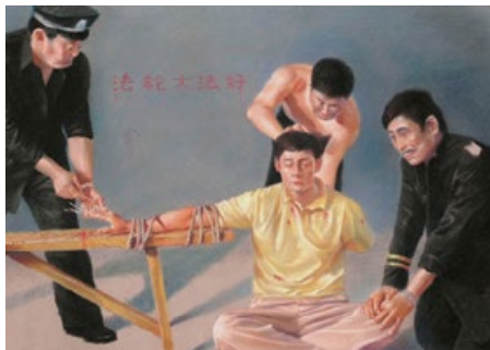
中共酷刑图示：用竹签扎手指