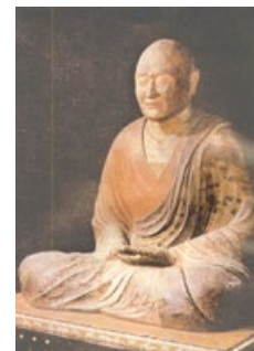
日本奈良唐招提寺的鉴真和尚干漆像

一千二百多年前，在中国唐朝，鉴真和尚准备东渡日本，弘扬佛法。他面对的是东海风急浪高、可能翻船、失去方向、饿死在茫茫大海的危险，还有来自唐朝政府的重重阻拦和拘禁等威