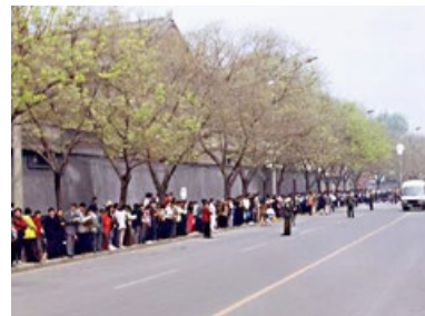
▲上访现场，秩序井然。

“四二五”和平上访，起因是中共江泽民集团不断制造事端，蓄意迫害法轮功：从1996年非法禁止出版法轮功书籍，到江泽民、罗干一伙扣押国务院总理对法轮功的正面批示；从1998年公安部四处派特务收集法轮功的“罪证”未果，再到动用公安强行驱散炼功群众，非法抄家……三年中，打压不断升级。最后终于由警察殴打及非法抓捕四十多名法轮功学员的天津事件，引发了1999年4月25日万人和平上访。法轮功学员上访，维护的是按“真善忍”做好人的权利，无关政治。◇