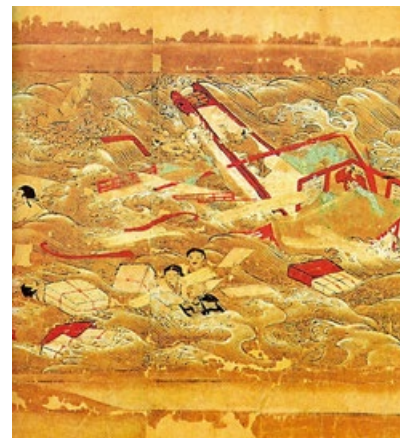
右图：《东征传》绘卷局部，鉴真东渡途中在狼沟浦遇险。

胁。在他的大弟子祥彦和日本僧人荣睿因病去世、他自己也身毒入眼、双目罹疾致失明、并且五次东渡失败之后，他还是坚定地扬帆起航，开始第六次征程。鉴真说过“是为法事也，何惜身命”。