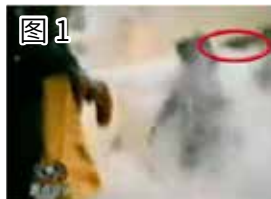
图 1 凶手猛击刘的头部