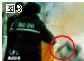
图 3 用手摸头，突然倒地