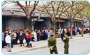
“4·25”上访现场。站在人行道上的法轮功学员，没有喧哗，没有口号，在静静等待朱镕基总理的有关回复。