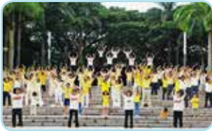
新加坡法轮功学员祥和的炼功场面，吸引许多当地民众与外国游客驻足观看，人们主动了解法轮功真相。