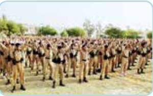
印度德里“警察训练大学”的上千名学生在集体学炼法轮功五套功法。一片祥和之气洋溢印度警察学校。

法轮功修炼者遍布亚洲 31 个国家和地区。印度各大城市都有法轮功炼功点。校园里更是修者众多，仅南部的班加罗尔市就有 80 多所大中小学的师生修炼法轮功。在韩国，法轮大法炼功点多达几百个，遍及各个城市。韩国各界及政要对法轮大法弘传本国深表谢意。2003 年，越南语《转法轮》出版。如今，法轮大法的炼功点已经遍布越南各个城镇。