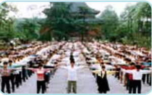
▶ 1998年5月，沈阳一万多名法轮功学员在辽宁工业展览馆前集体炼功。那时这样壮观的场景到处可见。

法轮功，又称法轮大法，1992年5月由李洪志先生传出，以“真善忍”为根本指导，包含五套动作优美的功法。法轮功教人向善，要求修炼者从做好人做起，提升道德水平，使人变得诚实，善良，宽容；修炼法轮功还能祛病健身，开启智慧，使修炼者逐渐达到洞悉人生和宇宙奥秘的自在境界。法轮功一经传出，短短几年传遍神州大地，上亿人身心受益。