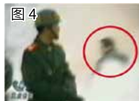
图 4 凶手打过人的姿势