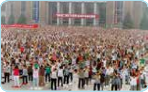
◀ 清晨，成都市法轮功学员自发到居家附近的炼功点参加晨炼。1999年初，四川成都已有几十万人修炼法轮功。