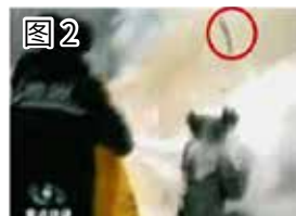
图 2 一“条状”物弹起