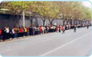
“4·25”上访现场。法轮功学员静静地站在人行道上，上访现场周围的街道秩序井然，警察在悠闲地聊天。

江泽民仇恨嫉妒法轮功修炼人数众多，很早就企图用媒介诬蔑、禁止出版法轮功书籍、警察骚扰等方式引起事端。1999 年 4 月，科索何祚庥在天津一杂志上撰文诬蔑法轮功，反映实情的部分法轮功学员被警察非法抓捕。4 月 25 日，法轮功学员到国务院信访局和平上访，江泽民以此为借口，于 1999 年 7 月发动了对法轮功修炼者长达 17 年的残酷迫害。