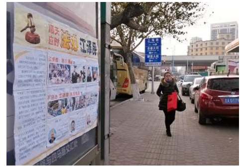
图：诉江展板出现在长春的各公交站台

大陆民众对控告江泽民大都非常支持，很多人说“早该起诉他了”、“活摘器官、天理不容”、“汉奸、卖国贼”等。一些大陆律师、学者、前中共高官在接受海外媒体采访时也