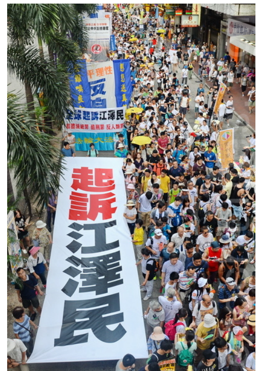
图：全球各地法轮功学员及民众声援在中国和全球兴起的诉江大潮。左上图：美国；左下图：日本；中上：加拿大；中下：台湾；右图：香港