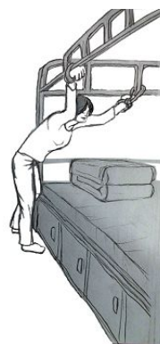
酷刑：长时间铐在床架上

每天十六、七个小时就这样站立体罚，只能身体前倾，身体重量都落在两个手铐与手腕的接触部位。