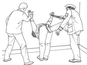
中共酷刑示意图：“飞”

到劳教所第一个晚上，犯人指使其他犯人用胳膊肘猛击我腰部，直到把我击倒，半个月后还腰部疼痛，并把身上的钱拿出，他们买东西吃。