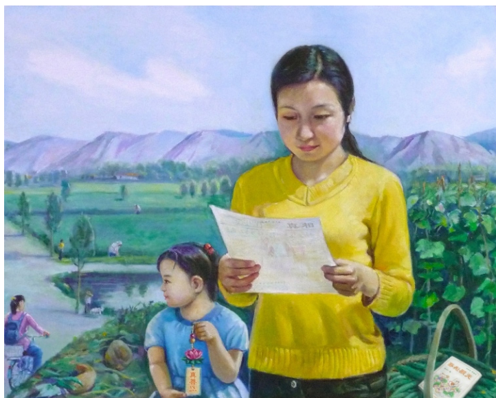
绘画：《阅读法轮功真相资料》

的闹剧，那不是对付人家炼功的，它是想对付我们这些不炼法轮功的。你看，人家法轮功不杀生、不自杀，说自杀有罪，所以那闹剧一出来，人家就知道是栽赃陷害！根本就没法骗炼功人。所以这个骗局一定是冲咱来的，他们编这些东西的真正目的是欺骗和谋害没炼过法轮功的人。