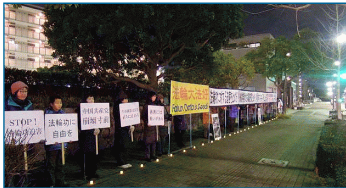
日本法轮功学员中领馆前烛光夜悼抗议迫害

二月七日下午二点到深夜十点，熊本地区的法轮功学员先后在长崎中领馆和福岡中领馆前，打开“法轮大法好”，“解体中共，停止迫害”，“立即停止对法轮功的迫害”，“立