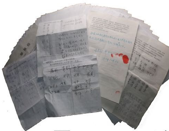
图 1：巴州区 1500 民众联署举报恶首江泽民

廊坊市政法委书记肖双胜，命令下属要抓捕五百名法轮功学员，话音刚落没几天，于 2013 年 11 月 18 日被双规；三河市政法委书记刘永宏，曾经推动部分中小学校成立诋毁法轮功的组织，2014 年 1 月 8 日突然暴病身亡；原三河市委书记李刚，经常叫嚣“坚决与法轮功斗争到底！”，于 2014 年 7 月 21 日被双规。