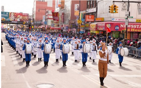
图左：二百多名训练有素的成员组成的“天国乐团”在法轮大法方阵中领头 图右：退党中心的腰鼓方阵

【明慧网】纽约华人社区规模最大的贺岁活动，一年一度的法拉盛新年大游行于 2016 年 2 月 13 日盛大登场，共有六十多个华裔、韩裔团体，二十多部花车参与，包括纽约州州长库默、副州长胡楚在内的民选官员也现身游行，向亚裔拜年，街道两旁观众如云。法轮大法团体、全球退党服务中心如往年一样共襄盛举参加游行。他们阵容鼎盛，队伍整齐，有气势如虹的天国乐团、婀娜多姿的古风仙女、“凤船”花车、传统“中国风”的腰鼓队……“吸睛”亮点一个接一个，使他们再度成为游行最亮丽的队伍，民众赞不绝口，纷纷说：“法