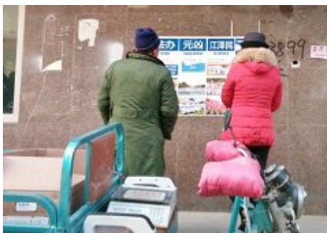
▲青岛市某地区诉江展板引路人驻足观看

所有参与迫害法轮功的人,都是在追逐碗底的那点“酱油”,成了真正的傻瓜,因为他们正接二连三地在灾难中,成为江泽民的陪葬品。◇