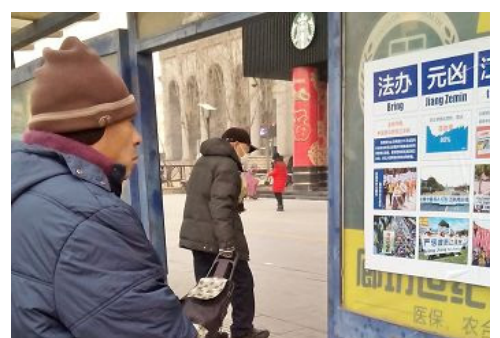
▲廊坊城区诉江图片让路人止步观看

奇书《九评共产党》深入剖析了中共的欺骗、残暴、邪教本质,引发了中国民众的觉醒,纷纷退出中共的党、团、队组织自救。至今在海外退党网站声明“三退”(退党、退团、退队)的人数:2亿多人。天灭中共,三退保命,您退了吗?