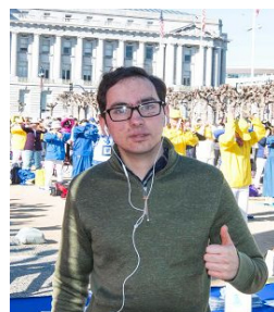
在莲花车上打坐的法轮功学员 民众听法轮功学员讲真相 旧金山企业家 Bacon