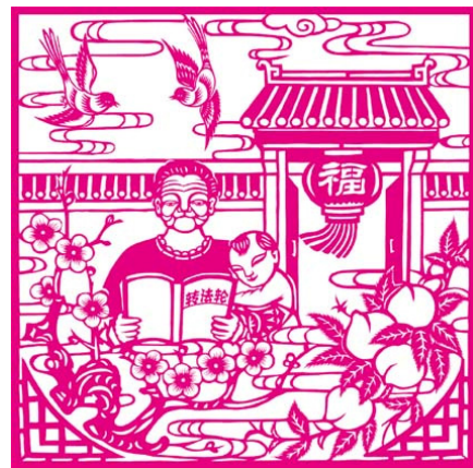
剪纸《福满堂》作者：大陆法轮功学员