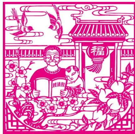
剪纸《福满堂》作者：大陆法轮功学员