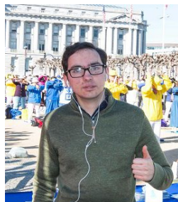
在莲花车上打坐的法轮功学员 民众听法轮功学员讲真相 旧金山企业家 Bacon