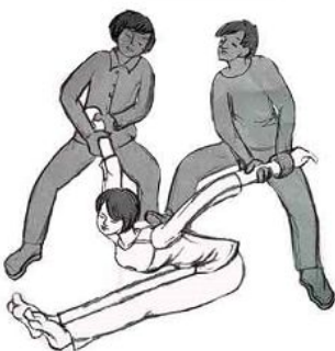
酷刑之一:强行“练瑜伽”