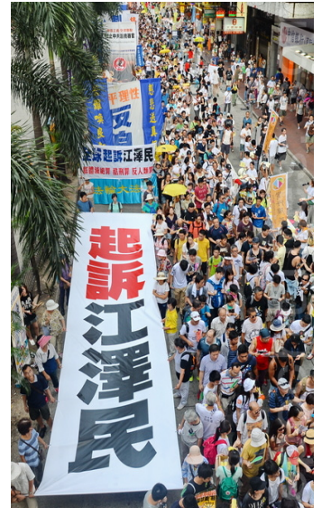
图:2015全球各地法轮功学员及民众声援在中国和全球兴起的诉江大潮,图为香港大游行。

下文从集录了106名中共副省部级以上高官落马的简况中摘取了吉林省部份实例。真诚(转下页)