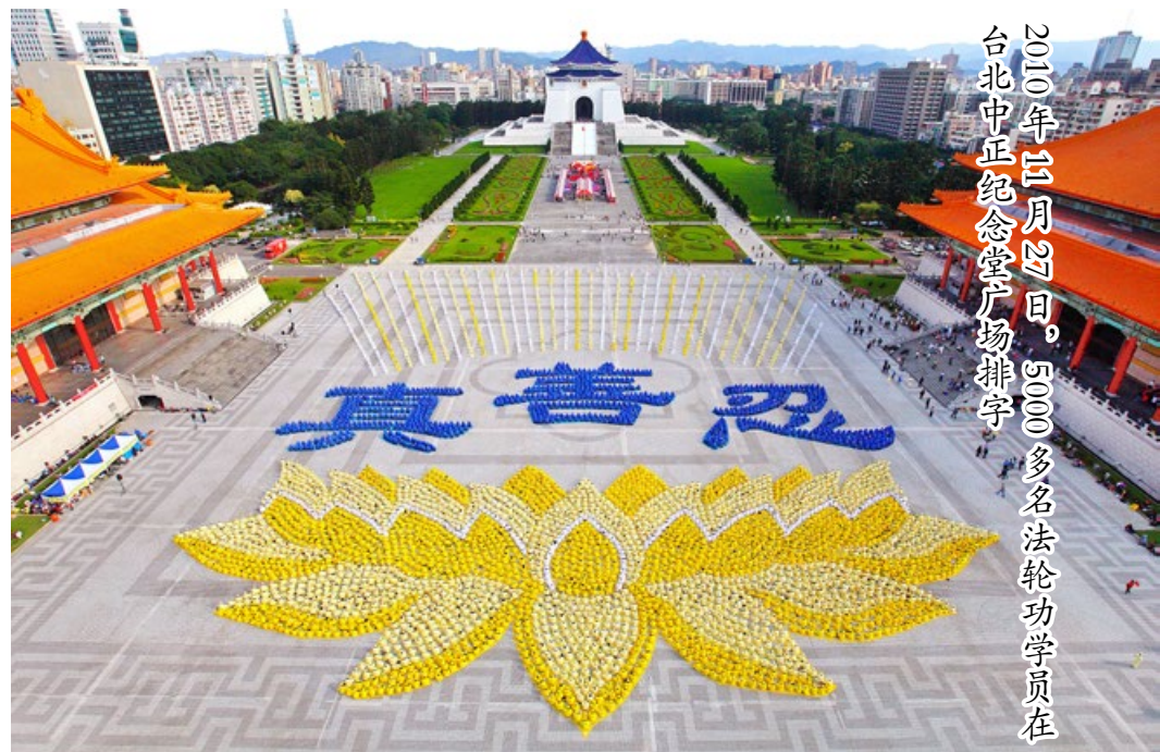
2010年二月27日，5000多名法轮功学员在台北中正纪念堂广场排字

法轮功一经传出，因其教人向善的法理和神奇的祛病健身效果受到人们的普遍欢迎，短短几年传遍神州大地，先后有1亿人修炼。