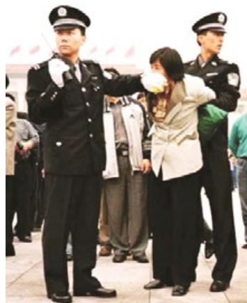
中共迫害法轮功学员

共以“假恶斗”的手段残酷迫害信仰“真善忍”的法轮功学员，甚至把他们酷刑折磨致死，使他们家破人亡，可反过来却说法轮功学员不顾亲情。而受到伤害的不只是法轮功学员，我们每一个中国人都是受害者。如今的中国社会道德如此败坏，人与人之间的关系如此紧张，都是中共几十年来败坏我华夏传统道德的恶果。