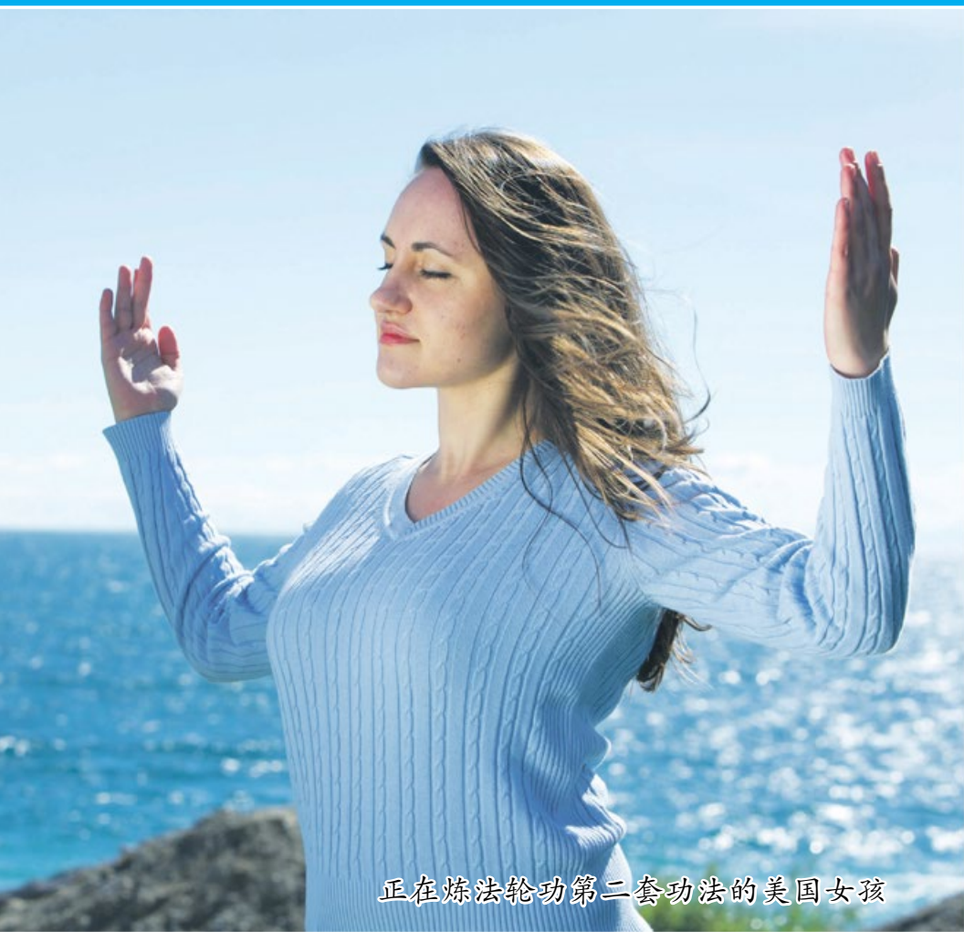
正在炼法轮功第二套功法的美国女孩