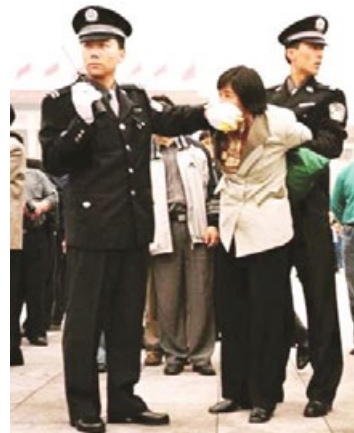
中共迫害法轮功学员

“假恶斗”的手段残酷迫害信仰“真善忍”的法轮功学员，甚至把他们酷刑折磨致死，使他们家破人亡，可反过来却说法轮功学员不顾亲情。而受到伤害的不只是法轮功学员，我们每一个中国人都是受害者。如今的中国社会道德如此败坏，人与人之间的关系如此紧张，都是中共几十年来败坏我华夏传统道德的恶果。