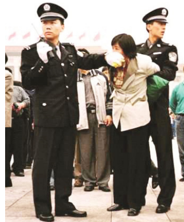
中共迫害法轮功学员

“假恶斗”的手段残酷迫害信仰“真善忍”的法轮功学员，甚至把他们酷刑折磨致死，使他们家破人亡，可反过来却说法轮功学员不顾亲情。而受到伤害的不只是法轮功学员，我们每一个中国人都是受害者。如今的中国社会道德如此败坏，人与人之间的关系如此紧张，都是中共几十年来败坏我华夏传统道德的恶果。