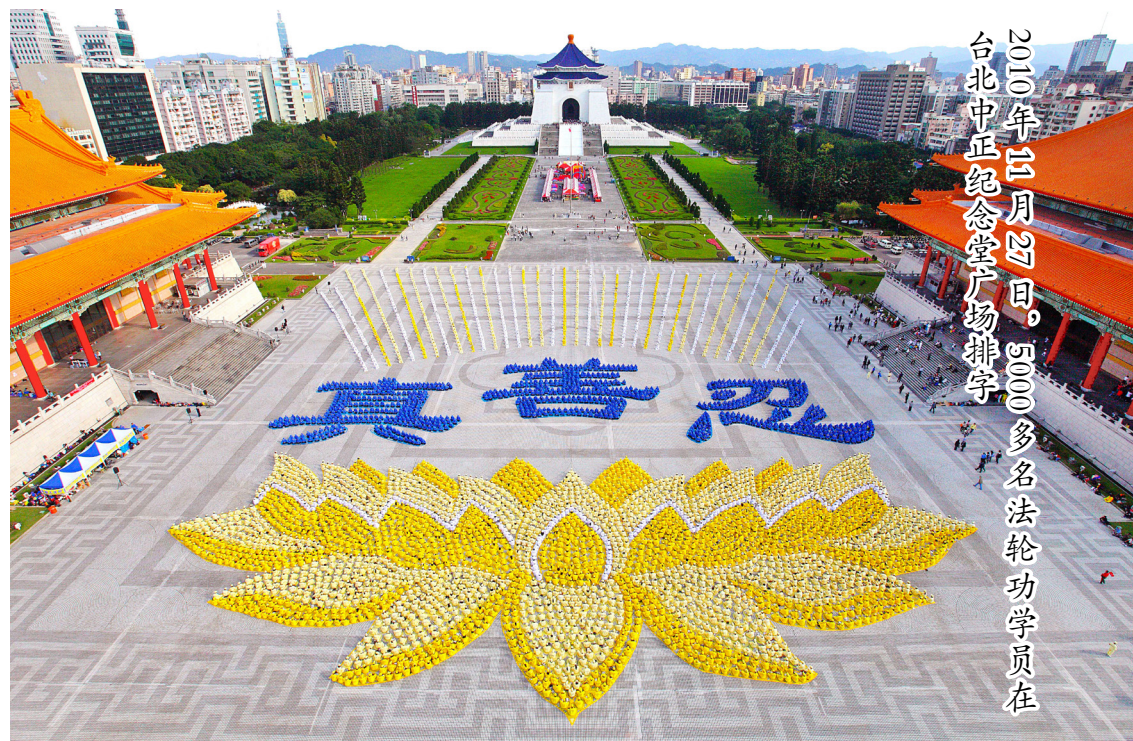
2015年二月24日，5000多名法轮功学员在台北中正纪念堂广场排字

最终，我精疲力竭，身体也亮起了红灯：脊柱骨膜炎，疼得我始终弓着背；成天坏肚子，下肢浮肿，脸黑得像烤鸡皮一样。我还常做噩梦，醒来后大汗淋漓。