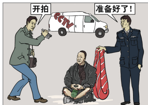
■ 中共为抹黑法轮功而导演了骗人的“天安门自焚”伪案。

邻居大哥是退伍军人，得了一种手脚都哆嗦的病，走路特别慢。一天，邻居大哥在后边喊我，我回头一看，大哥迈着大步、乐呵呵地向我走来，看来病好了。我问他：“护身符带上了吗？大哥说：“我把它放在我家最高处供起来了，我真得福报了。”◇