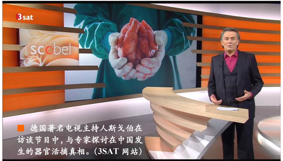
德国著名电视主持人斯戈伯在访谈节目中，与专家探讨在中国发生的器官活摘真相。

属，以及参与器官移植的中国医生家属的采访，采集证词并分析数据，揭露出令西方公众震惊的一幕：自江泽民1999年在中国发起对法轮功的灭绝性迫害后，法轮功修炼者成为器官移植的主要来源，中共的国家机器和医院组成完整系统，从被关押的法轮功学员身上活生生摘取器官，贩卖给患者来牟取暴利，手术室成了杀人的刑场。