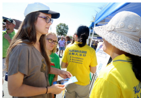
图：美国女孩在听真相

参加集会的许多人远远地看到醒目的标题，不由自主停下来，走近摊位，仔细阅读展板。表情慢慢变得很严肃。有的人问这是真的么？太残