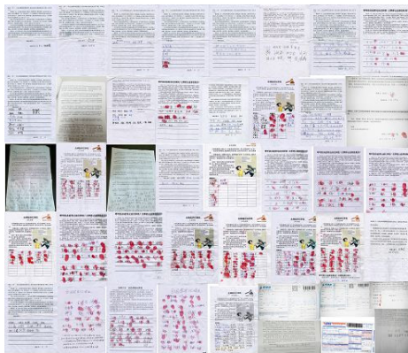
图：三河市 1121 人签名举报江泽民

在大陆只要一提江泽民，从老百姓到邪党老干部，几乎没有不骂它的！说江泽民反腐喊的欢，可是打下来的老虎徐才厚、周永康等等，哪个不是江泽民的铁杆、迫害法轮功的干将？说娼妓遍地，是不是得从江泽民玩弄女人说起？他卖国，签个字就将