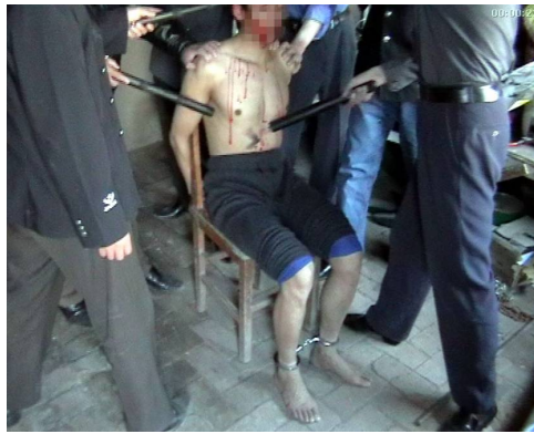
中共折磨法轮功学员的酷刑之一： 电棍电击

折磨，恶警唆使刑事犯看着我们，不准闭眼睛，不准盘腿。我不听他们的，他们就将我关进小号，铐在暖气管子上，坐在小凳上一个姿势，铐了半个月，手肿得象馒头，屁股也疼痛难忍。我绝食半个月，他们就强制灌食。