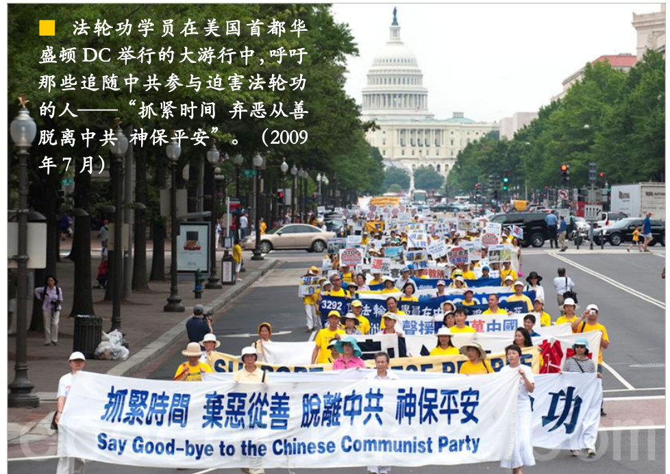
■ 法轮功学员在美国首都华盛顿 DC 举行的大游行中，呼吁那些追随中共参与迫害法轮功的人——“抓紧时间 弃恶从善 脱离中共 神保平安”。（2009年7月）

中共前党魁江泽民为迫害法轮功，于1999年6月10日专门成了“610办公室”这样一个法外机构。