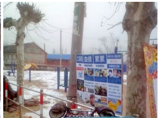
上图：山东各地的诉江展板