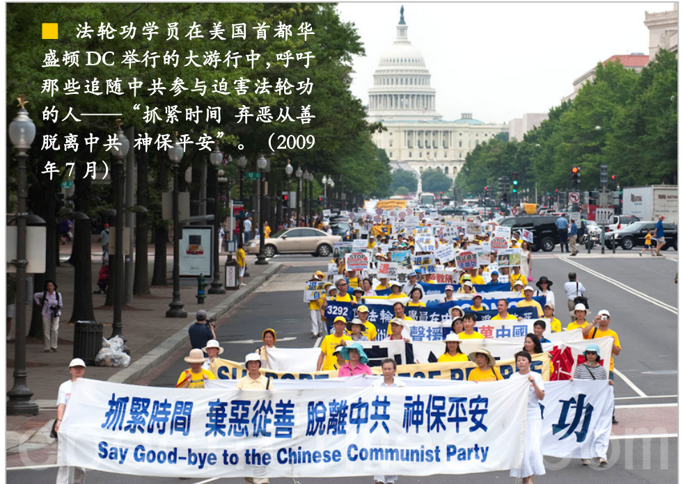
■ 法轮功学员在美国首都华盛顿 DC 举行的大游行中，呼吁那些追随中共参与迫害法轮功的人——“抓紧时间 弃恶从善 脱离中共 神保平安”。（2009年7月）

中共前党魁江泽民为迫害法轮功，于1999年6月10日专门成了“610办公室”这样一个法外机构。