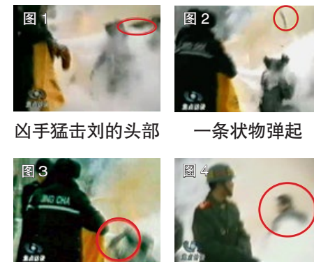
图1 凶手猛击刘的头部