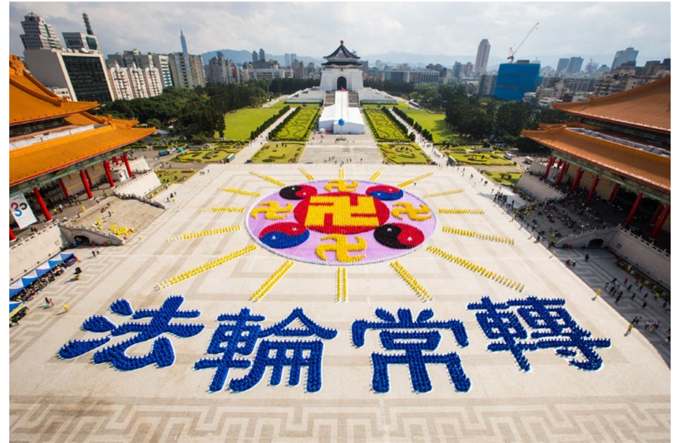
▲ 台湾 6300 多名法轮功学员在自由广场排出“法轮图形”及“法轮常转”四字图像。

从北京来台出差的梁医生及杨医生赞叹排字场面盛大，令人备感舒服。看到这么多法轮功学员不论男女老幼都体现出祥和善良的面貌，穿着整洁朴素，他们心生敬仰之情，很羡慕台湾尊重信仰自由的环境。听到法轮功学员被中共活摘器官，他们非常震惊，杨医生表示：怎会有活摘器官这样离谱的事情发生！