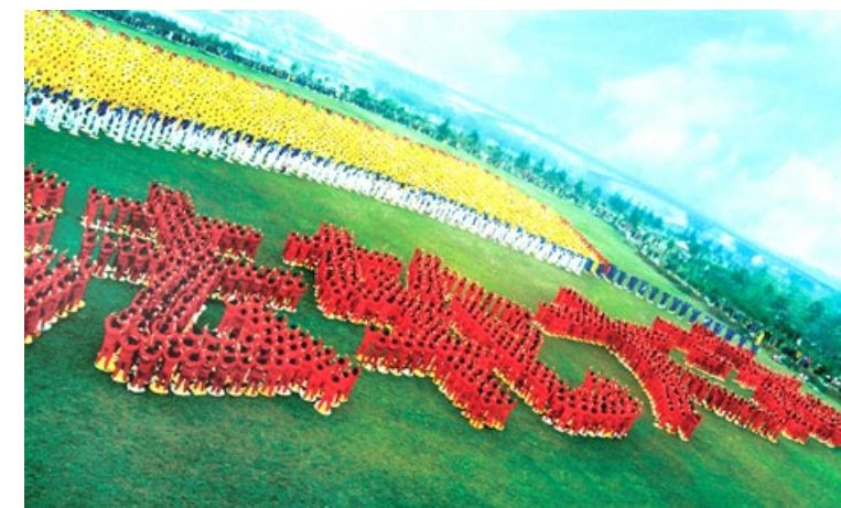
▲ 1999年3月，武汉法轮功学员排出“法轮大法”四个大字

法轮功自1992年5月13日由李洪志先生从中国长春传出，以简单明白的法理和祛病健身的奇效吸引了无数有识之士，至今已弘传世界100多个国家，上亿人修炼。法轮功主要著作《转法轮》被翻译成30多种文字出版发行，受到各族裔人民的喜爱。法轮大法的各种书籍，可以在法轮大法网站 FalunDafa.org 免费下载。