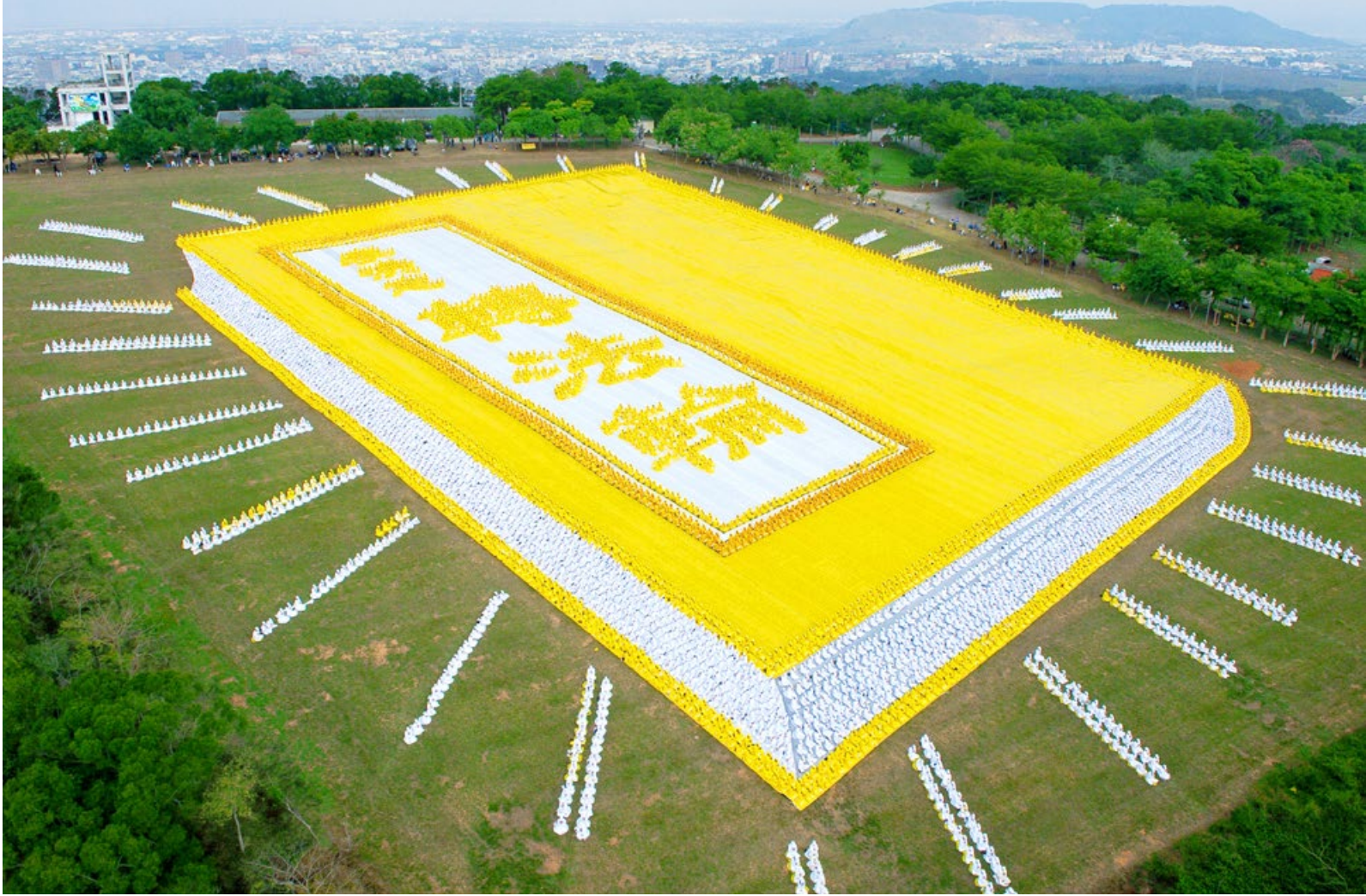
▲ 台湾 6000 多名法轮功学员在台中排出指导修炼的《转法轮》图形

在中共十几年的迫害中，追随江泽民迫害法轮功的王立军、薄熙来、周永康等纷纷落马，那些不知悔改的恶徒一个个遭到应有的报应。愿所有人都能善待法轮大法。