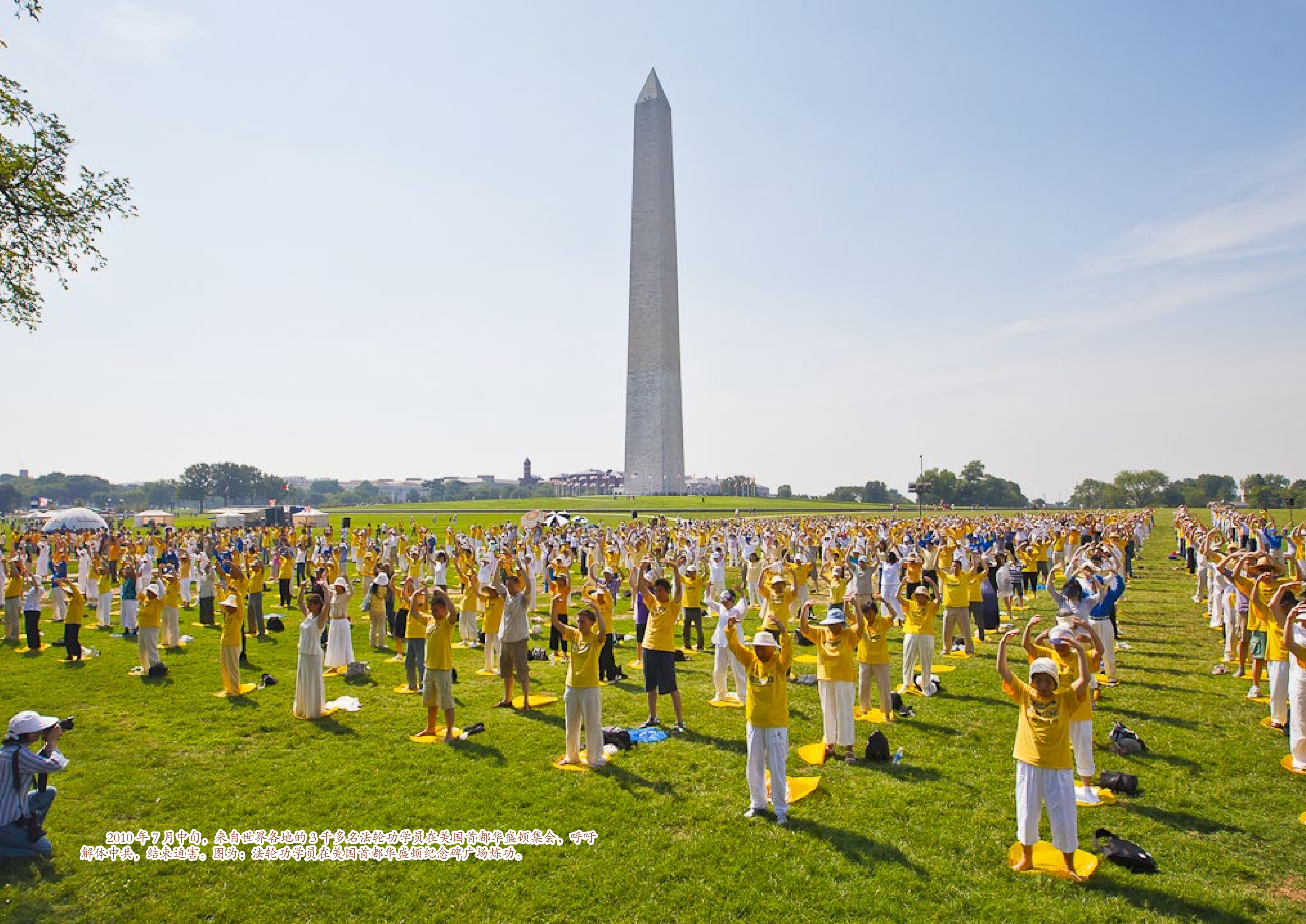
2010年7月中旬，来自世界各地的3千多名法轮功学员在美国首都华盛顿集会，呼吁解体中共，结束迫害。图为：法轮功学员在美国首都华盛顿纪念碑广场炼功。