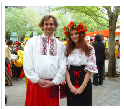
▲ EuggenBfug 和 TotiongStou

5月的纽约，8千多名不同国家、不同族裔的法轮功学员欢聚一起，向李洪志师父表达崇高的敬意，通过各种活动与世人分享自己修炼“真、善、忍”而获得身心升华的体会。