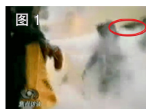
图 1 凶手猛击刘的头部