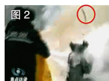
图 2 一条状物弹起