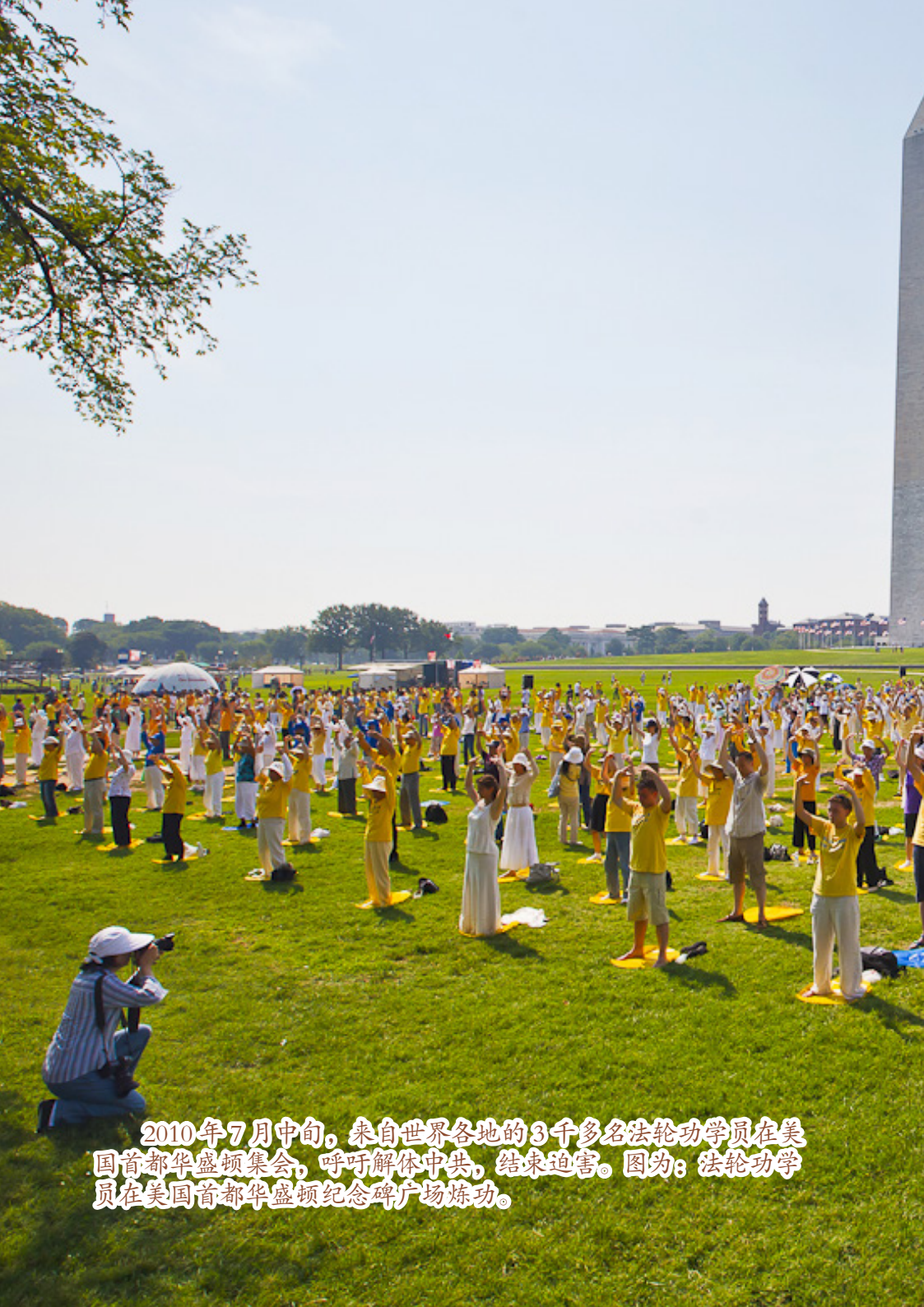
2010年7月中旬，来自世界各地的3千多名法轮功学员在美国首都华盛顿集会，呼吁解体中共，结束迫害。图为：法轮功学员在美国首都华盛顿纪念碑广场炼功。

受吗？” 因为那时候，中共已经开始迫害法轮功了。和大多数中国人一样，我了解法轮功，只能是电视里、报纸上所宣传的那些内容。看过的假报道，在我脑海里还有点可怕的印象，可是我也不知道当时是哪来的力量，毅然地笑着回答道：“我可以。”