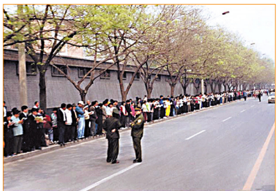
▲ “四·二五”上访现场。秩序井然，警察在悠闲地聊天。

（接 24 页）因为这个图形的颜色非常漂亮，而且参与排字的人也都表现得非常平和、专注，我相信在现场的所有观众都被他们吸引住了，甚至很想参与其中。” Stacy 表示要把拍摄的影片带回去放在网络上和大家分享。