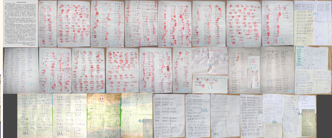
▲ 2300 人联名营救周向阳（部分签名）

周向阳出生在秦皇岛昌黎县，从小就很善良，挨别人欺负时从不抱怨，学业优秀，从北方交通大学毕业后分配到天津铁道第三勘探设计院工经处，因工作出色，单位送他到天津大学，又获得投资经济硕士学位。1998 年考取了全国造价工程师职业资格，当时全国考过造价师的人只有 60 个。他思维敏捷，工作细致认真，兢兢业业，从不与人争。