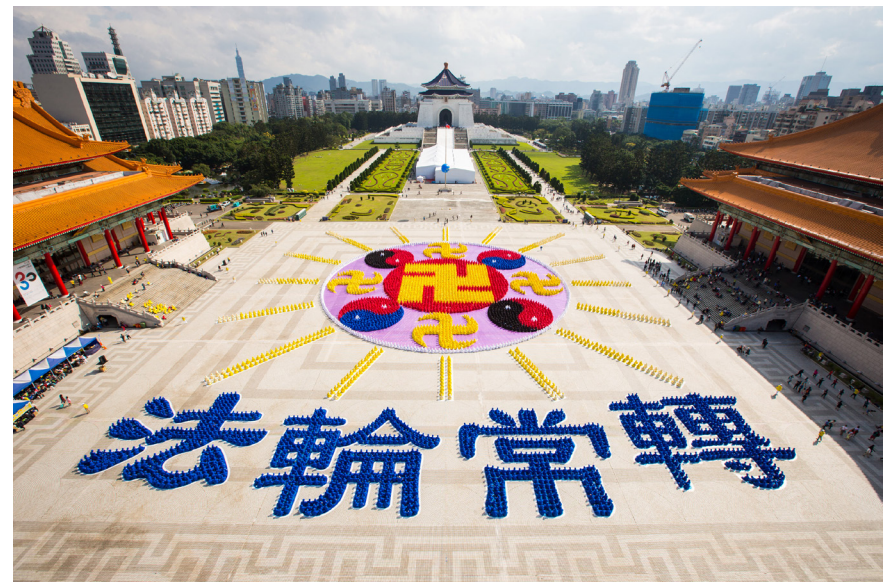
▲ 台湾6300多名法轮功学员在自由广场排出“法轮图形”及“法轮常转”四字图像。

说到共产党，现在很多人都开始摇头了，在这个一党专政的国家里，人民被愚弄得太深太久了，已经麻木了。很多麻木的人，已经懒得去思考自己的人生价值，只向钱看，失