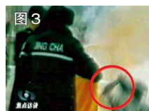
图 3 用手摸头，突然倒地