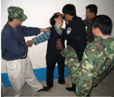
中共酷刑演示：拳打脚踢

一次晚上收工回监室，女犯让我坐在地上，我说：“我要坐凳子。”她们不给。这时一女犯拿起一个塑料小板凳对准我头的两边太阳穴就猛击了三下，我差点被她打死过去。瞬