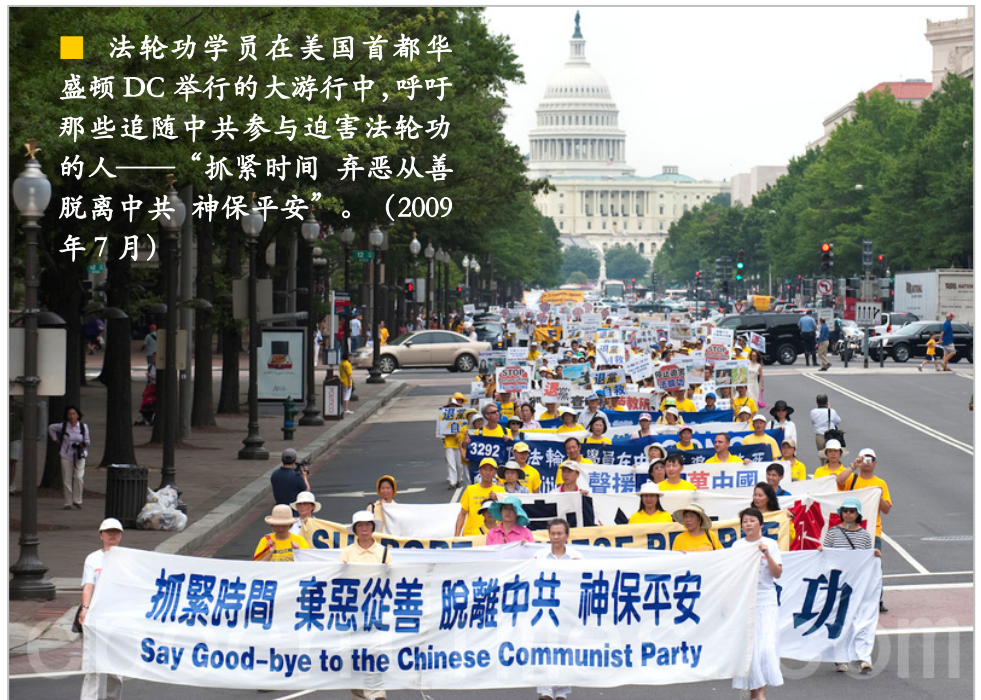
■ 法轮功学员在美国首都华盛顿 DC 举行的大游行中，呼吁那些追随中共参与迫害法轮功的人——“抓紧时间 弃恶从善 脱离中共 神保平安”。（2009年7月）

中共前党魁江泽民为迫害法轮功，于1999年6月10日专门成了“610办公室”这样一个法外机构。