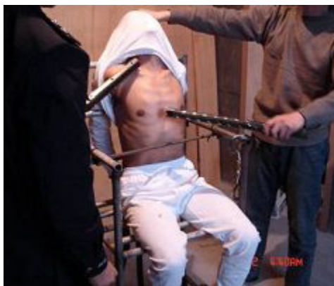
中共酷刑示意图：电棍电击

这几个警察都是年轻的壮汉，光着上身，有的只穿着一条大裤头，累得他们汗流浹背的，当时正是伏天高温季节，警察们怕让别人知道