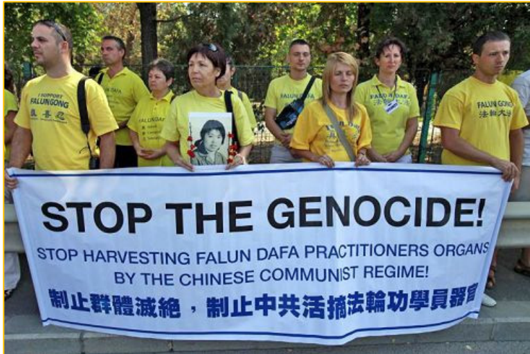
左图：法轮功学员在中共驻美大使馆前抗议。

众所周知的是，多年来，中共早已从被关押者身上，特别是从死囚身上进行“捐献器官”。对此，国际医学界领袖、政府官员和国际组织都强烈谴