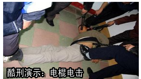
酷刑演示：电棍电击

在镇赉县看守所，我被非法关押了七个月，又以所谓的“破坏国家法律实施罪”这么个不伦不类的罪名诬判了我七年，送进四平市石岭子监狱迫害。逼迫说污蔑大法的话，然后叫我写五书（即揭批书、认罪书、悔过书、转化书、保证书）。由于我不配合，恶警就扒光了我的上衣按在地上，用脚踩着我的头，然后用超高压的电棍对我进行不停歇的电击，直到恶警下班了，我的身上已经到处都是焦痕。