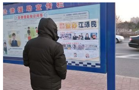
▲ 由十六张 A4 纸组合的诉江展板，出现在长春各公共场所，展板向长春百姓历数着中共恶首江泽民的罪恶。