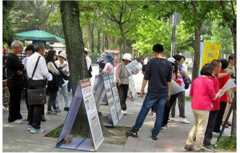
在台北“国父纪念馆”景点中国游客专注细看真相

一位青年表示他戴过红领巾，在净之帮忙取化名三退之际，他旁边的同伴欲加阻止，担心会因此回国