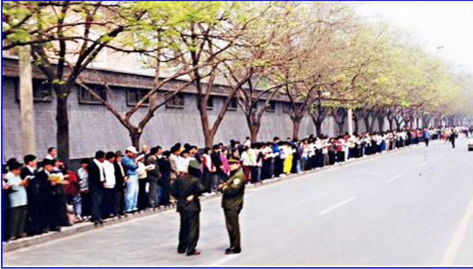
“四·二五”和平大上访现场,法轮功学员秩序井然,警察在悠闲的聊天。

1999 年 4 月 11 日,前中共政法委书记罗干的连襟何祚庥,在天津教育学院《青少年科技博览》杂志发表文章,以捏造事实的卑劣手段,指名恶毒攻击、陷害、诬蔑法轮功。4 月 18 日至 24 日,部分天津法轮功学员前往天津教育学院及相关机构反映实情,要求取消何祚庥的文章。23 日和 24 日,天津市公安局动用防暴警察殴打和非法抓捕法轮功学员,致使学员流血受伤,40 多人被抓。